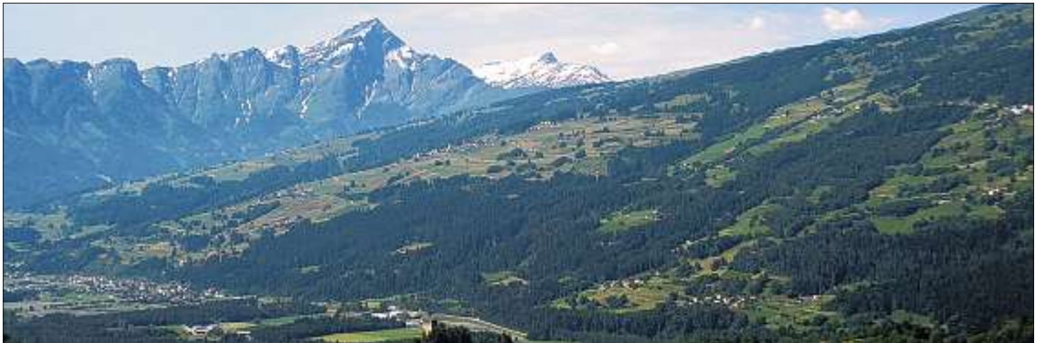
Die neue Gemeinde Cazis umfasst das ganze Gebiet des äusseren Heinzenbergs.

AMTLICHES PUBLIKATIONSORGAN FÜR DIE GEMEINDEN MITTELBÜNDENS