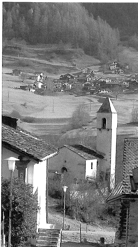
Die Bündnerische Gemeinde Clugin hat auf den 1. Januar 2009 mit Pignia und Andeer zur Gemeinde Andeer fusioniert.

Die Ausarbeitung eines Fusionsvertrages stellt ein geeignetes Mittel dar, um offene rechtliche Fragen im Zusammenhang mit einer Gemeindefusion zu regeln. Der Fusionsvertrag findet deshalb in vielen Kantonen Anwendung und bildet in der Praxis das zentrale rechtliche Element. Grundsätzlich wird er nur bei der freiwilligen Fusion verwendet. Die Zustimmung zum Fusionsvertrag entspricht dem kommunalen Fusionsbeschluss. Fusionsverträge enthalten ähnlich interkantonalen Vereinbarungen