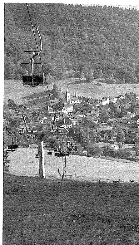
Per 1. Januar 2009 wurde im Kanton Neuenburg aus neun Gemeinden die neue Gemeinde Val-de-Travers gegründet.

Die Vertragsparteien erwarten, dass die fusionierte Gemeinde den Fusionsvertrag einhält und nicht anpasst. In der Praxis ist deshalb oft die Forderung hörbar, die Verträge hätten «für immer» zu gelten. Trotzdem muss auch der Fusionsvertrag beendet oder zumindest angepasst werden können, wenn er aufgrund veränderter Verhältnisse fehlerhaft wird. Die Rechtsbeständigkeit ist eingeschränkt. Die unbegrenzte Dauer liesse sich mit den Grundprinzipien des öffentlichen Rechts nicht vereinbaren. Die Rechtsbeständigkeit des Fusions-