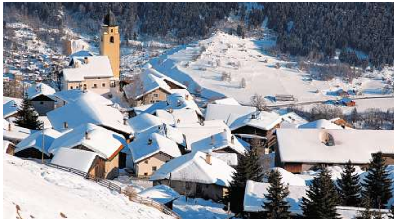
Gemeinsam in die Zukunft? Mathon ist eine der fünf Schamser Berggemeinden, die vielleicht bald mit der Talgemeinde Zillis-Reischen fusionieren.

Eine Besonderheit ist für Zillis-Reischen (heute 55 Prozent) und Rongellen geplant: ein Fonds mit 250 000 Franken, um auf drei bis fünf Jahre hinaus die Steuerfusserhöhung abzufeu-