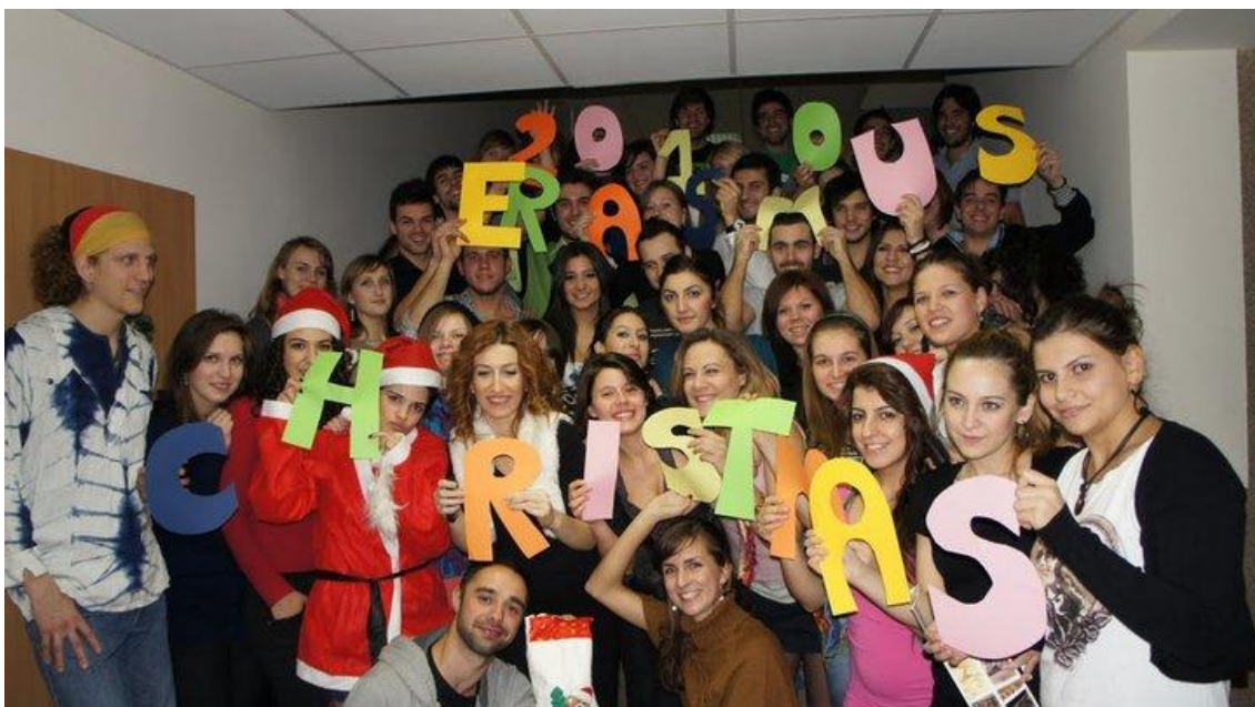
Xmas-Dinner mit allen Erasmusstudenten

Ich würde sofort wieder ein Semester an dieser Schule oder allgemein im Ausland absolvieren. Es ist eine grossartige Erfahrung und ich kann es wirklich nur jedem empfehlen.