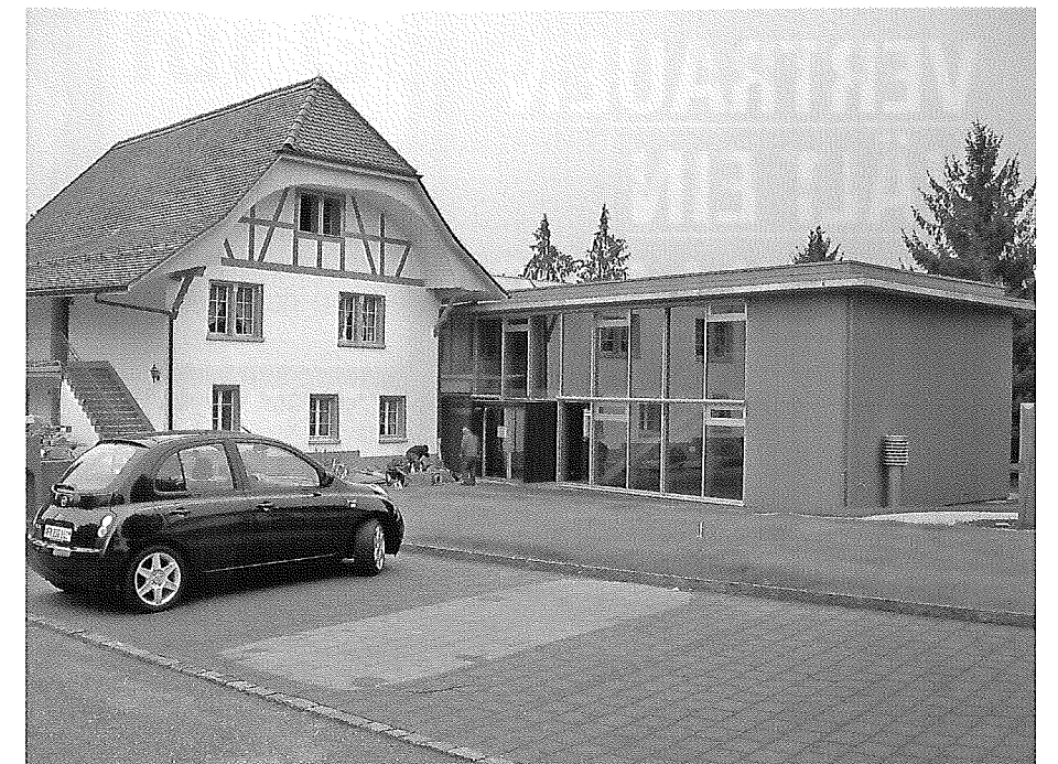
Die Verwaltung der sieben Dörfer umfassenden Gemeinde Gurmels wurde kürzlich um einen Neubau erweitert.

Eine Fusion bietet die Möglichkeit, sich weiterzuentwickeln und die Vorteile der bisherigen Institutionen zusammenzuführen. Diese Chance wird sehr unterschiedlich genutzt, weil die fusionierten Gemeinden durch die Regelung des (übrigen) Tagesgeschäftes stark in Anspruch genommen werden. Es finden