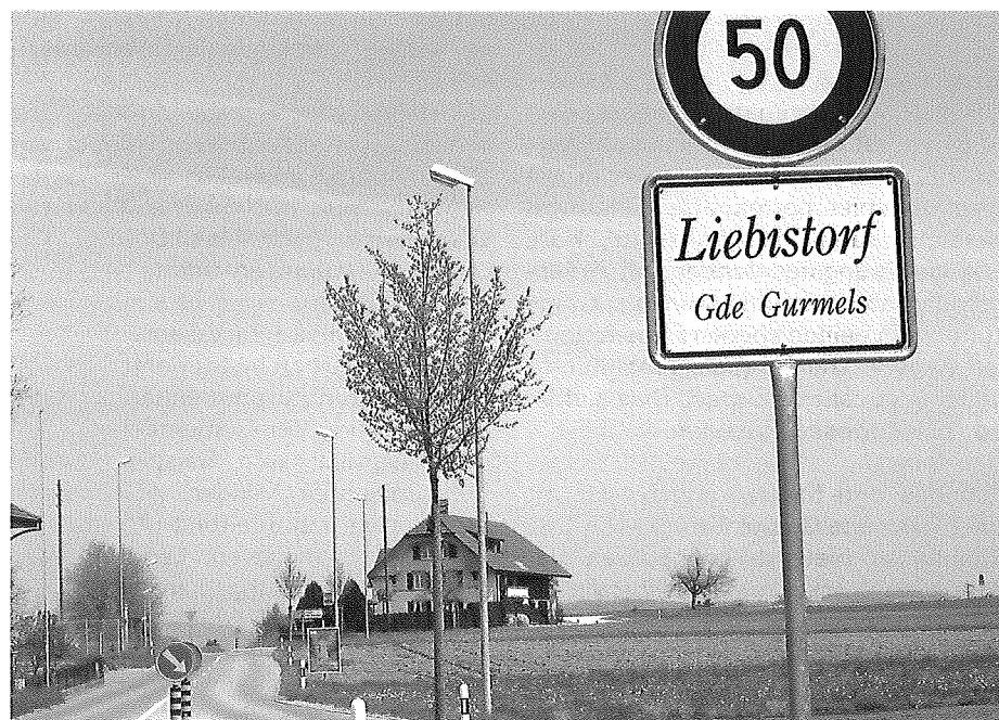
Erfolgreiche Fusion im Kanton Freiburg: Liebistorf hat sich 2002 mit Gurmels, Guschelmuth und Wallenbuch zur Gemeinde Gurmels zusammengeschlossen.

Für die grosse Mehrheit der Gemeinden verliert das Thema Fusion rasch nach der Inkraftsetzung an Bedeutung, da sich für viele Einwohner fusionsbedingt gar nichts verändert. Es zeigt sich, dass alle grossen Gemeinden dieser Aussage zustimmen. Aber auch bei Kleingemeinden beträgt die Zustimmungquote 50 Prozent. Immerhin wird verschiedentlich betont, dass insbesondere in ehemaligen Kleingemeinden nach wie vor alles mit früher verglichen