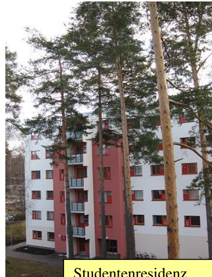
Studentenresidenz Lohentie 13B

Dazu kommt, dass die Haaga-Helia eine super Betreuung für Austauschstudenten anbietet: Die Tutoren holen dich vom Flughafen ab, begleiten dich zur Bank oder in den Supermarkt um zu erklären, welches die „normale“ Milch ist (das ist bei einer