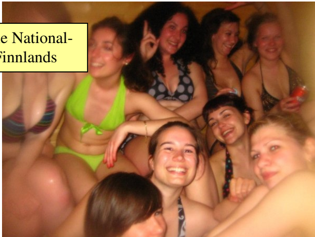
Sauna: die National- sportart Finnlands

Auswahl von ca. 10 verschiedenen Sorten gar nicht so einfach – vor allem, weil alles in einer völlig unverständlichen Sprache angeschrieben ist!). Vor Studienbeginn werden zwei „Orientation days“ für exchange students organisiert, wo Stundenpläne besprochen, Passwörter vergeben, wichtige Informationen vermittelt und Helsinki gezeigt werden.