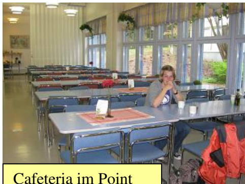
Cafeteria im Point House

Nach drei Semestern an der HTW Chur bin ich nach Finnland geflogen um an der Haaga-Helia Fachhochschule einen Auslandsaufenthalt zu absolvieren. Haaga-Helia besteht aus verschiedenen Schulen in Helsinki, Vierumäki und Porvoo. Mich hat es nach Porvoo verschlagen, einem kleinen Städtchen, das sich eine knappe Stunde von Helsinki befindet. Porvoo ist die zweitälteste Stadt Finnlands und die Heimat von ungefähr 40'000 Einwohner. Nach offiziellen Angaben zumindest. Allerdings werden da auch alle Häuser mitgezählt, die sich irgendwo in den weiten Wäldern rund um Porvoo herum befinden. Die Stadt selber erscheint eher klein und herzlich.