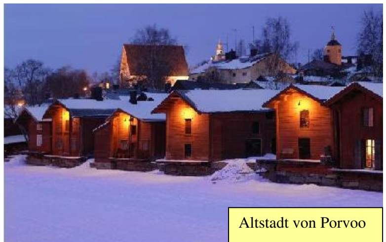
Altstadt von Porvoo

Die Haaga-Helia in Porvoo besteht aus zwei Häusern (Pomo-Talo und Point-Talo), wo sich Betriebsökonominnen und Tourismus-Studenten treffen. Die Schule bietet finnische und englische Studiengänge an. Aufgrund der begrenzten Auswahl an englischen Kursen sind die Studiengänge Tourismus und Betriebsökonomie nicht so klar abgetrennt und oft können Module zusammen belegt werden. Die meisten Austauschstudenten studieren Tourismus. Ich war unter 19 Exchange students die einzige Betriebsökonomie-Studentin! Die Haaga-Helia ist eine Partnerschule der HTW und ich konnte deshalb mit ERASMUS gehen.