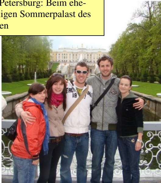
St. Petersburg: Beim ehemaligen Sommerpalast des Zaren