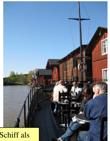
Paahimo mit Schiff als verlängerte Terrasse

Tipp: Das Café Paahimo ist der Ort, wo sich alle Studenten treffen. Dort habe ich stundenlang gesessen, meine köstliche heisse Schokolade getrunken und mit anderen Studis geschwätzt.