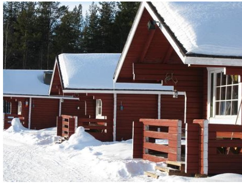
Korvola, unser „Cottage Village“