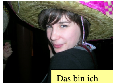
Das bin ich