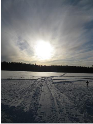
Lapland: Natur pur