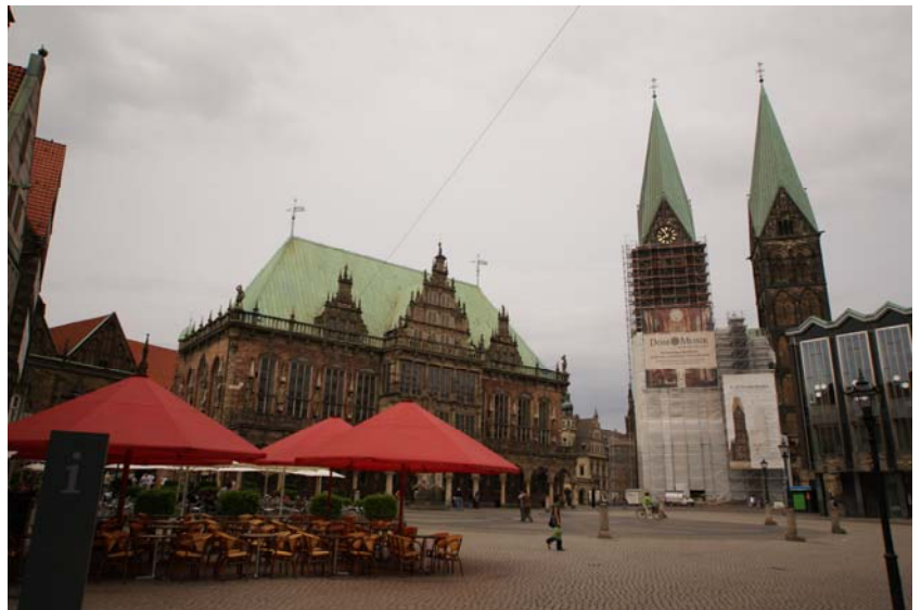
Marktplatz mit Rathaus und Dom