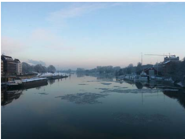
Die Weser im Dezember...