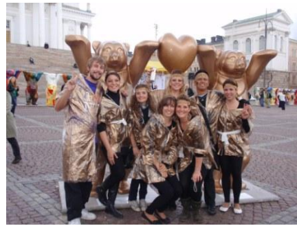
Freshmen Party in Helsinki

Schon zu Beginn meines Studiums befasste ich mich mit dem Gedanken, ein Auslandsemester zu absolvieren. Ich wollte neue Leute und ein neues Land kennen lernen und sehen, wie das Schulsystem im Ausland funktioniert. Da Finnland für seine gute Bildung bekannt ist und mich der Norden reizte, entschied ich mich für Porvoo, eine kleine Stadt in der Nähe von Helsinki.