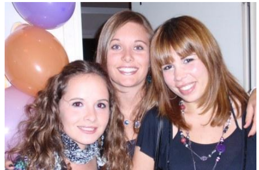
Meine beiden Mitbewohnerinnen

Ich würde das Auslandsemester auf jeden Fall wieder machen, weil es eine super Erfahrung war und ich viele neue Leute kennenlernte und neue Erfahrungen machen konnte.