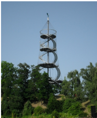
Der Turm auf dem Killesberg