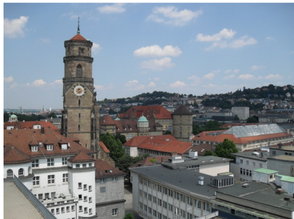
Stuttgart im Sommer