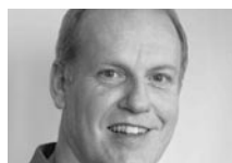
Martin Stalder Ressortleiter höhere Berufsbildung, Bundesamt für Berufsbildung und Technologie (BBT), Bern

Um die Ziele des Kopenhagen-Prozesses erreichen zu können, hat die EU eine Reihe von Instrumenten entwickelt. Das zentrale Instrument ist dabei die Entwicklung eines Europäischen Rahmens der Qualifikationen ( European Qualifications Framework, EQF )