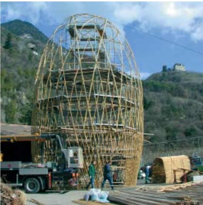
Links: HTW Chur an der Meranflora 2004 Rechts: Weltrekord mit Strohbällen

Die HTW Chur ist im Rahmen des nationalen