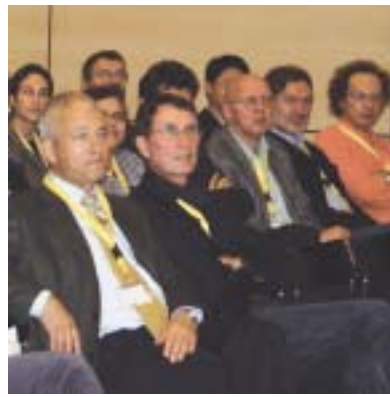
ISI 2004 an der HTW Chur

Die Dozierenden des Kompetenzbereiches wirkten an zahlreichen Publikationen mit und waren bei mehreren internationalen Konferenzen, z. B. in Helsinki, Frankfurt, Potsdam, Bangkok, mit Beiträgen vertreten.