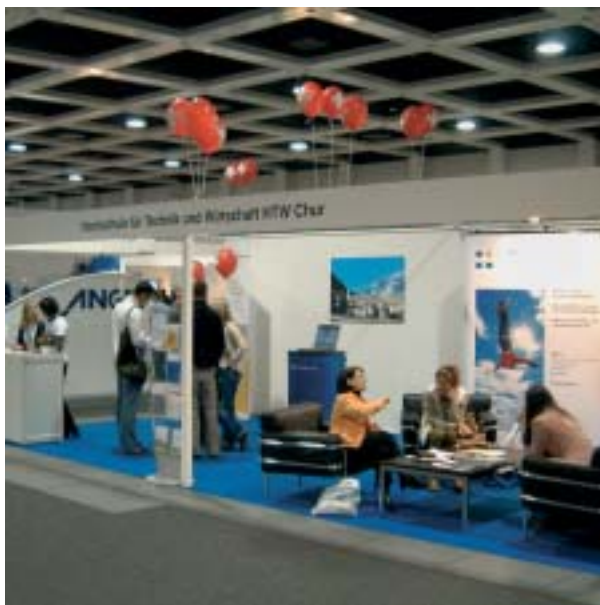
HTW Chur an der ITB (Internationale Tourismusbörse) Berlin

Das einmalige Studienkonzept des Diplom-Studienganges Tourism and Hospitality bewährt sich, davon zeugt auch die Verdoppelung der Studierendenzahl innerhalb eines Jahres. Was Praxisorientierung des Studienganges bedeutet, mussten die Studierenden gleich von Anfang an lernen. So konnten sie einen zweitägigen Destinationsbesuch nach Luzern gleich selber organisieren. Auch im Bereich Umwelt und Nachhaltigkeit machten sich die Studierenden anhand einiger praktischer Beispiele selbst ein Bild über die Bedeutung des Lebensraums für den Tourismus.